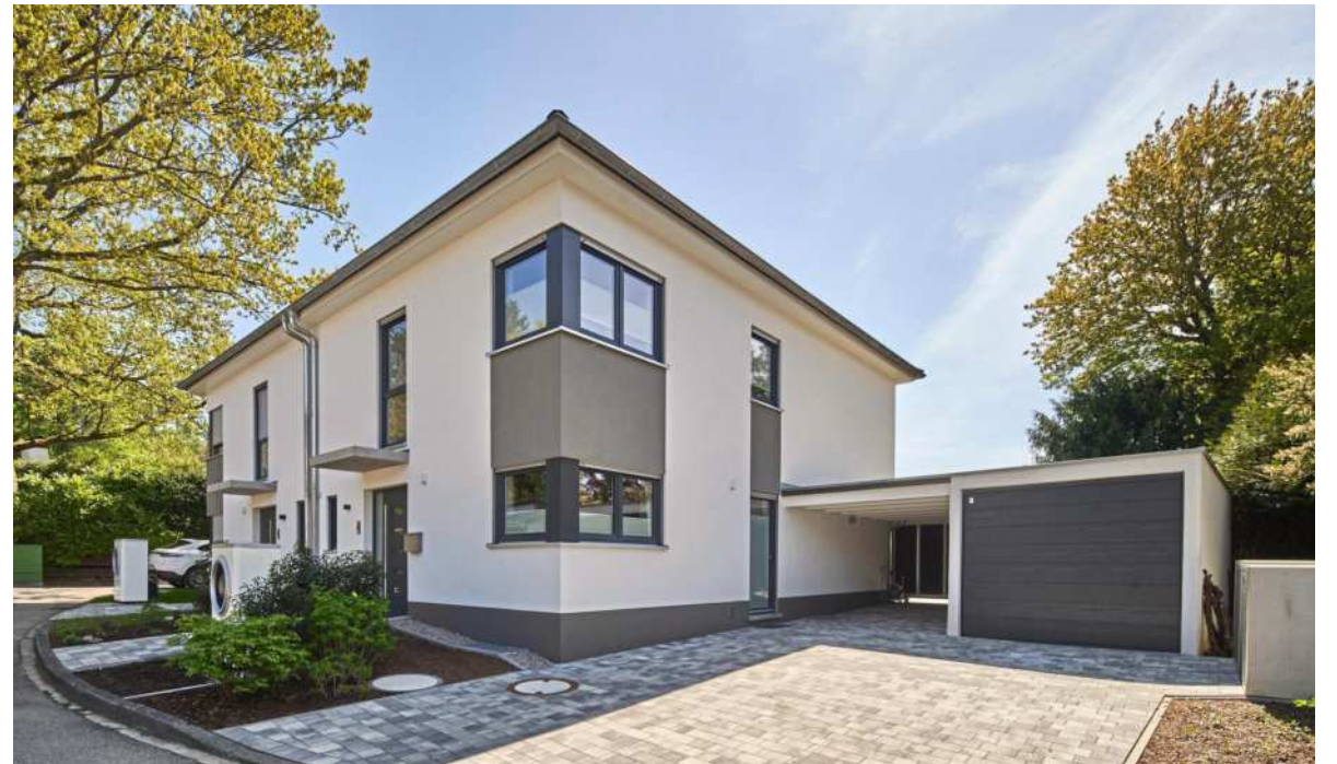
Dieses moderne Doppelhaus überzeugt durch seine massive Bauweise.