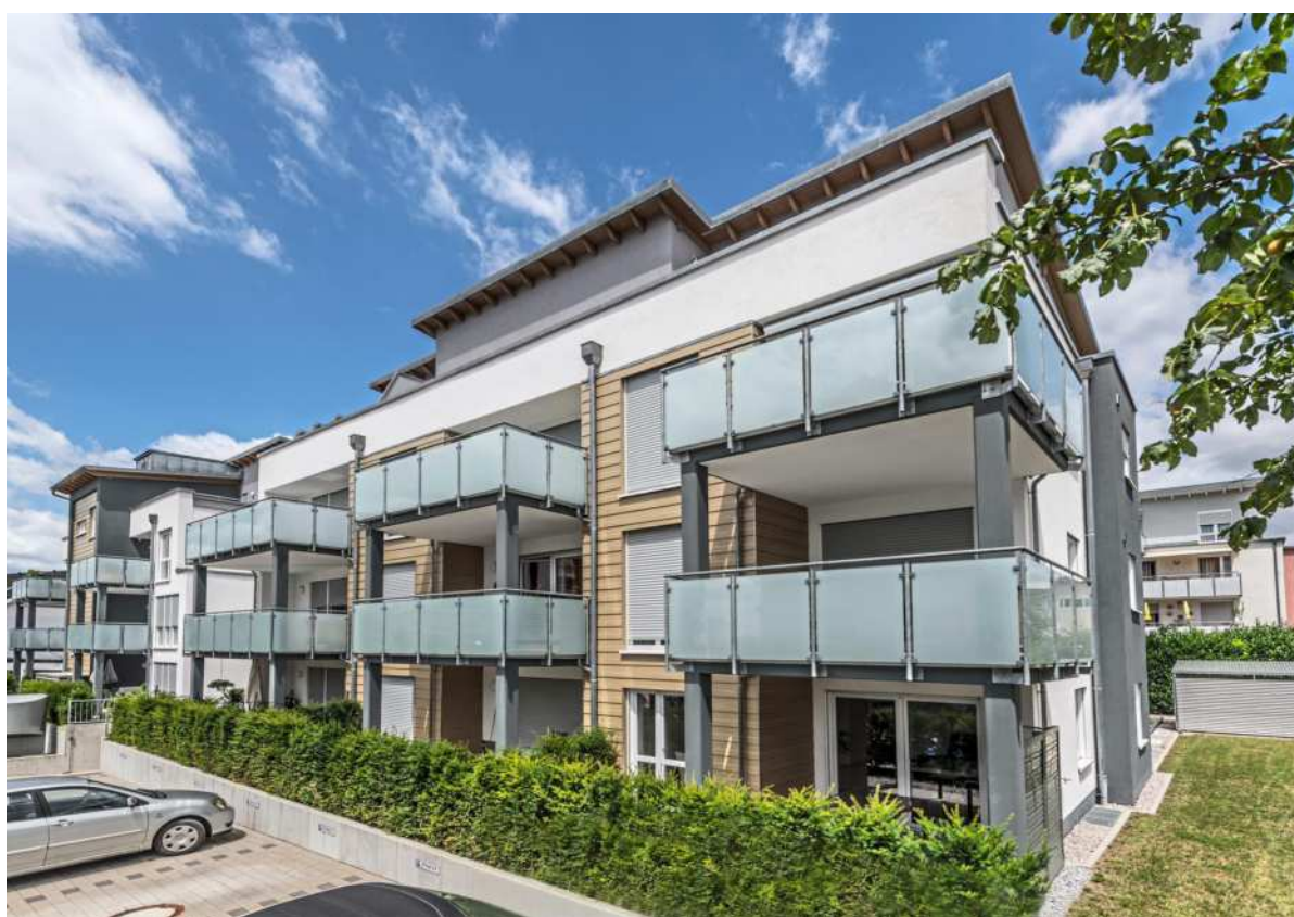
Die Objekte von BAU 72 erfüllen stets die baurechtlichen und energetischen Anforderungen an ein Mehrfamilienhaus.