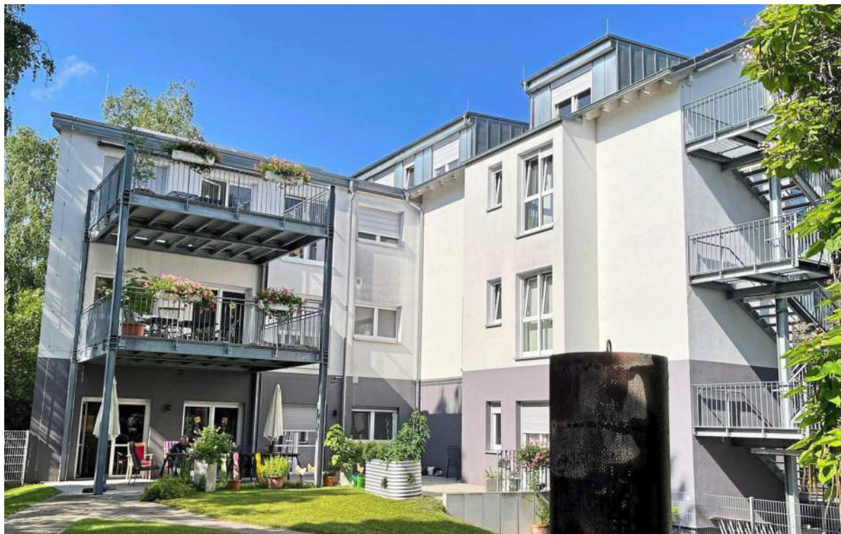
Die von BAU 72 realisierten Anlagen haben je nach Modell einen Betreiber oder Verwalter, der die Abwicklung übernimmt.

Form der Kapitalanlage sehr wichtig. Ebenso wie die Frage ob die Wohnung in absehbarer Zeit selbst oder erst im Alter genutzt werden soll? Wenn diese zunächst fremdgenutzt werden soll, muss sie auch den Kriterien des Marktes entsprechen. vglk / pr