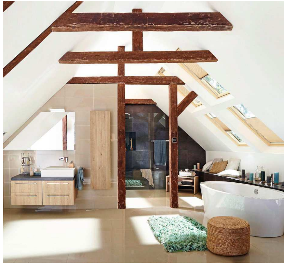
Schöner Stilmix: Mit der entsprechenden Erfahrung und Expertise lassen sich die Räume in Altbauten modernisieren. Im Vorfeld empfiehlt es sich, eine Prüfung durch einen Energieberater vornehmen zu lassen.