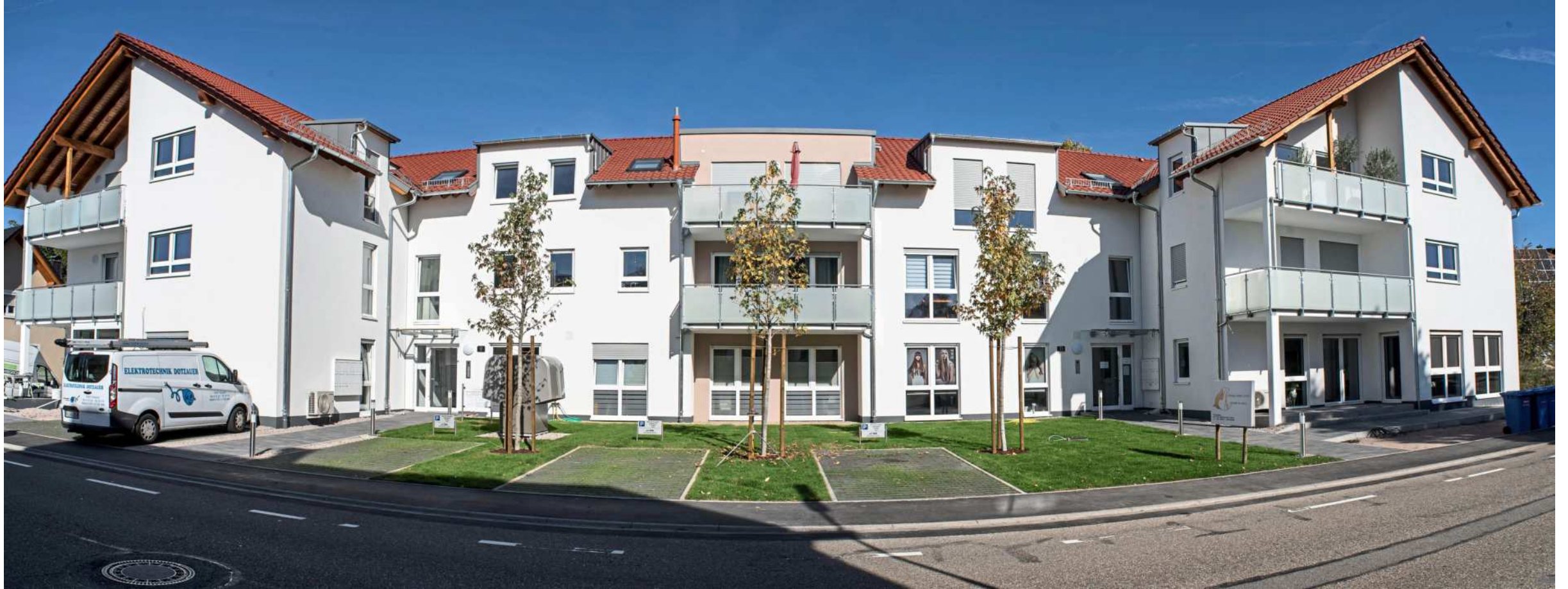
Mindestens ein Geschoss in Mehrfamilienhäusern von BAU 72 wird komplett barrierefrei ausgeführt.

Neubau | Erweiterung | Wohneigentum – exzellente Planung – perfekte Ausführung