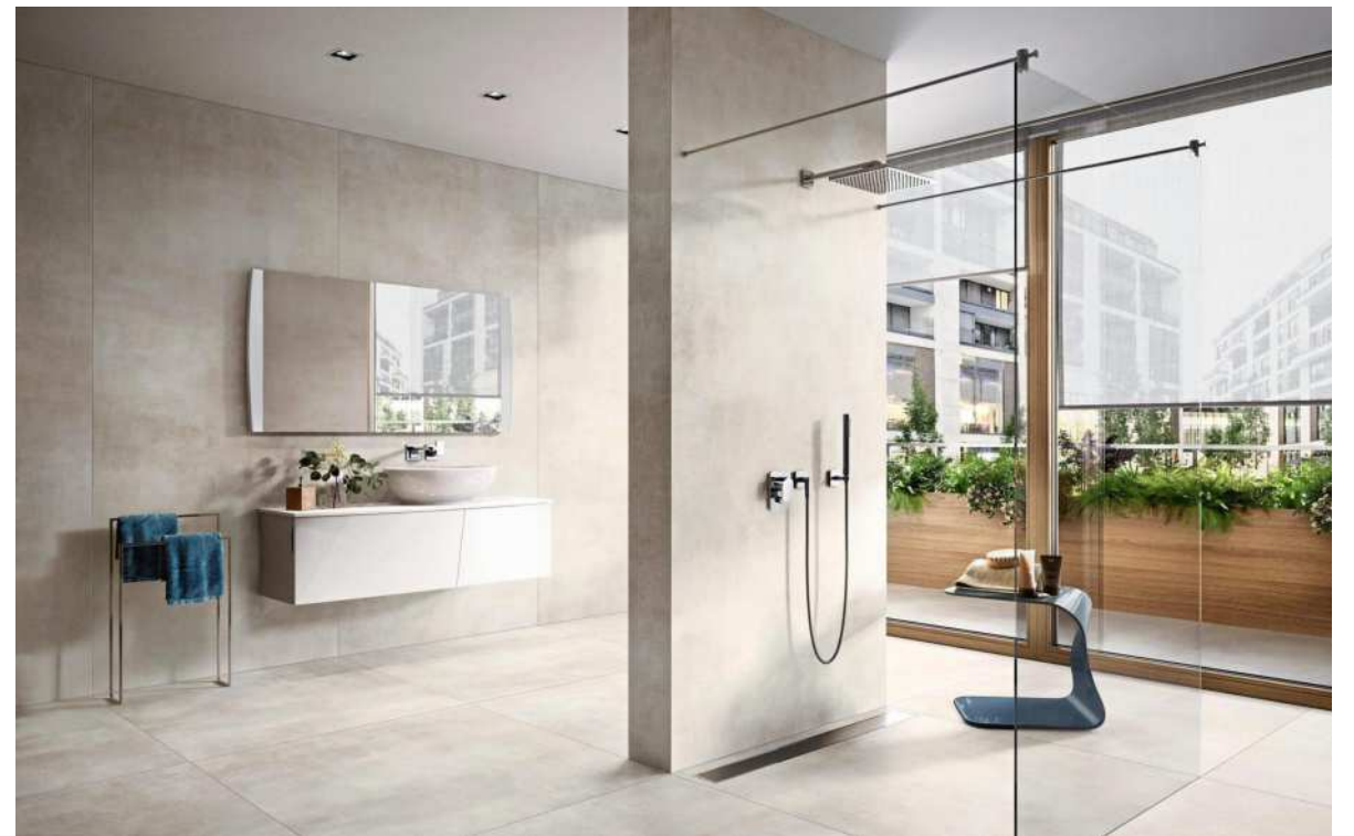
Ein ganz wesentlicher Aspekt bei der Planung eines Neubaus ist ein barrierefreies Badezimmer.